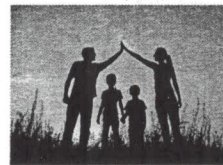
ЛЮБИТЬ И БЕРЕЧЬ

В каком случае суд может принять решение об отобрании ребенка у родителей (одного из них) без лишения их родительских прав (ограничении родительских прав)?